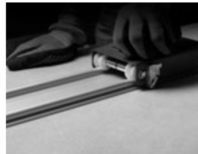
Cutting detail with guide on slab. Detalle de corte con guía sobre plancha.

LA INSTALACIÓN DE GRANDES FORMATOS REQUIERE DE HERRAMIENTAS Y UNA FORMACIÓN ESPECÍFICA POR PARTE DEL COLOCADOR. A DEMÁS DE LAS ANTERIORES, ESTAS SON ALGUNAS DE LAS RECOMENDACIONES A TENER EN CUENTA EN LA INSTALACIÓN DE GRANDES FORMATOS CERÁMICOS: