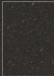
Soft Textured Finish

WEGA BLACK Soft Textured Finish Escala 1/3