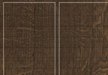
Soft Textured Finish Anti-slip Finish

Color Body Porcelain | Porcelánico Masa Coloreada Rectified | Destonified V.3 | Rectificado | Destonificado V.3 Nº Designs By Format | Nº De Diseños Por Formato: 22,5x200: 32 | 22,5x160: 32 | 20x120: 33