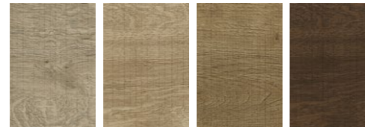
Ombra Sand Ombra Cognac Ombra Walnut Ombra Cocoa