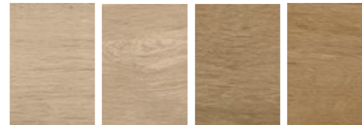
Niu Sand Niu Canella Niu Light Walnut Niu Autumn