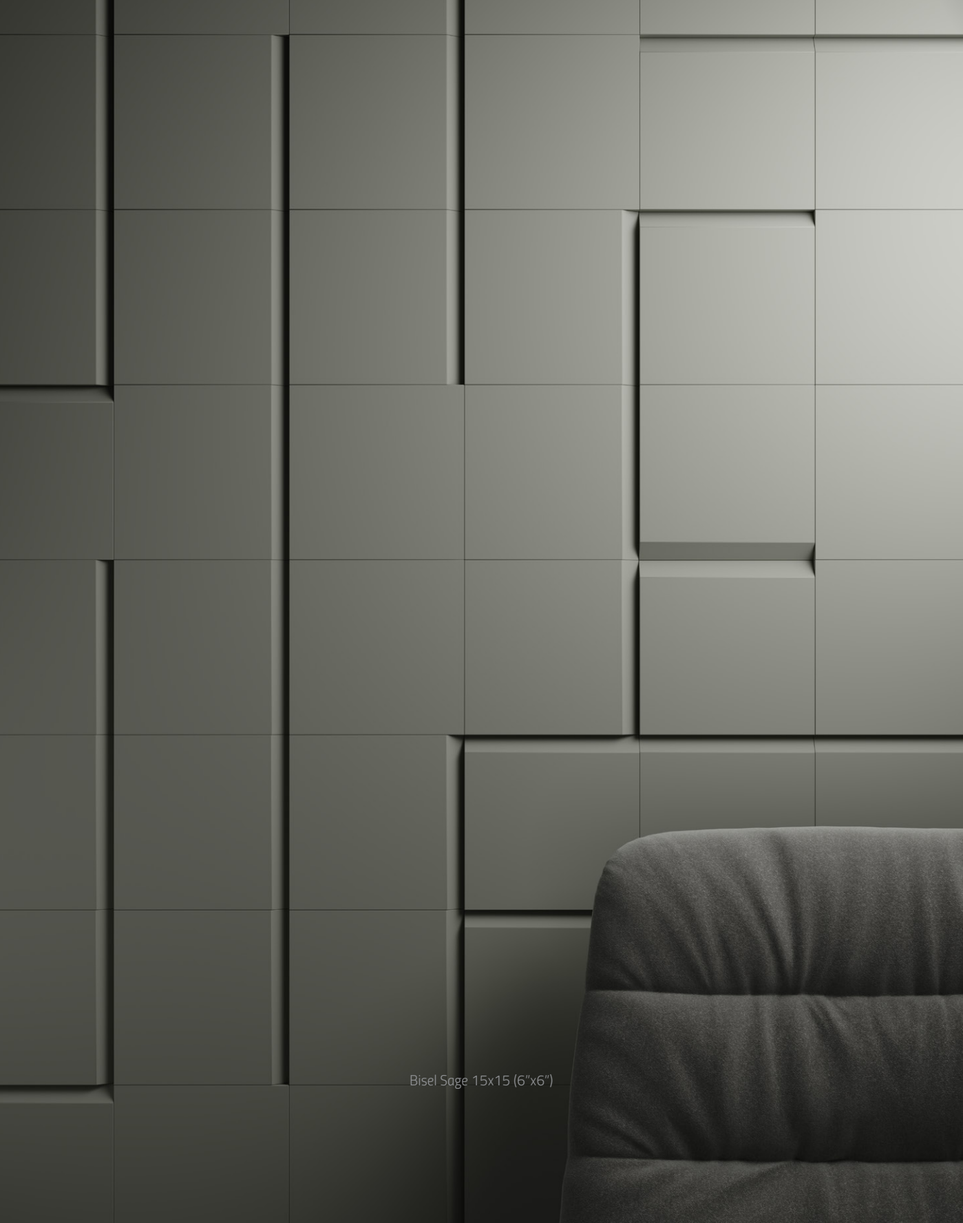
Bisel Sage 15x15 (6"x6")