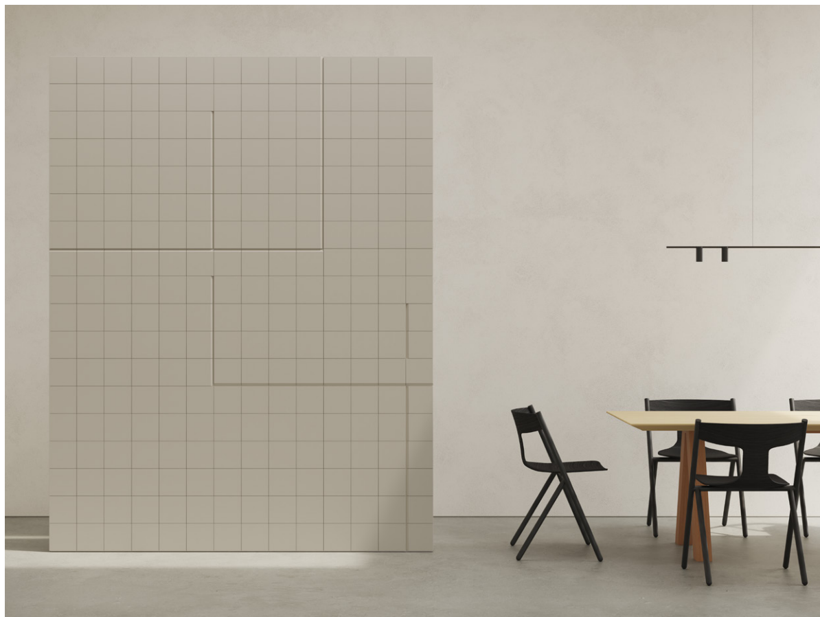
Bisel Linen 15x15 (6"x6")