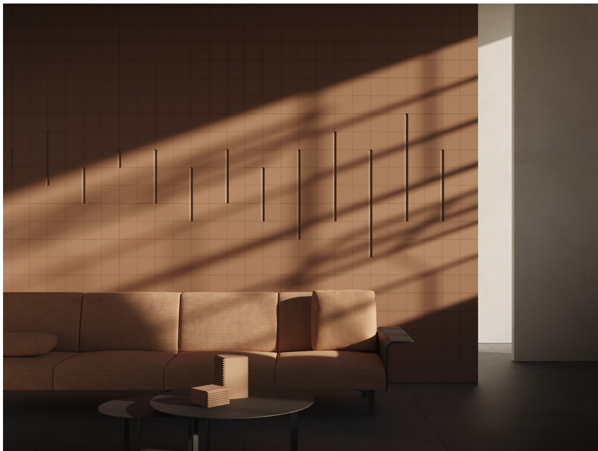
Bisel Tuscan Red 15x15 (6"x6")