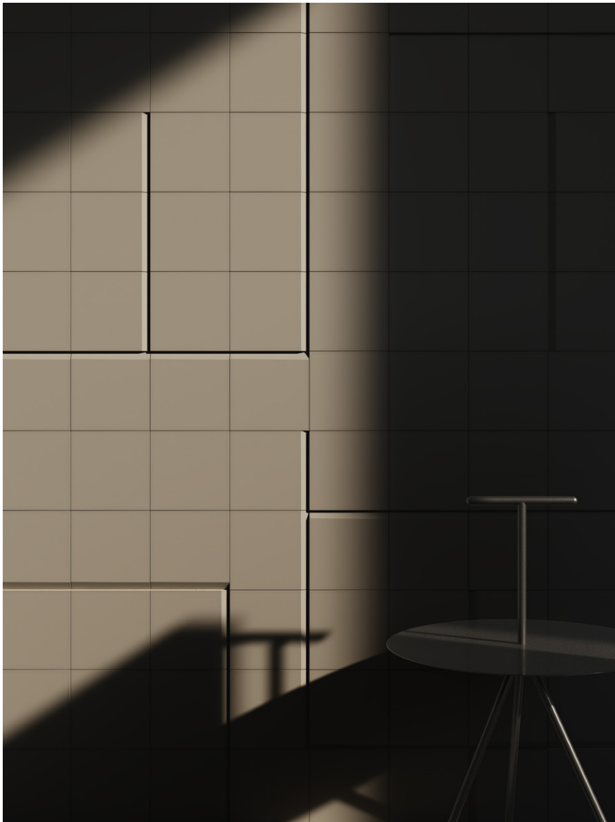
Bisel Pietra15x15 (6"x6")