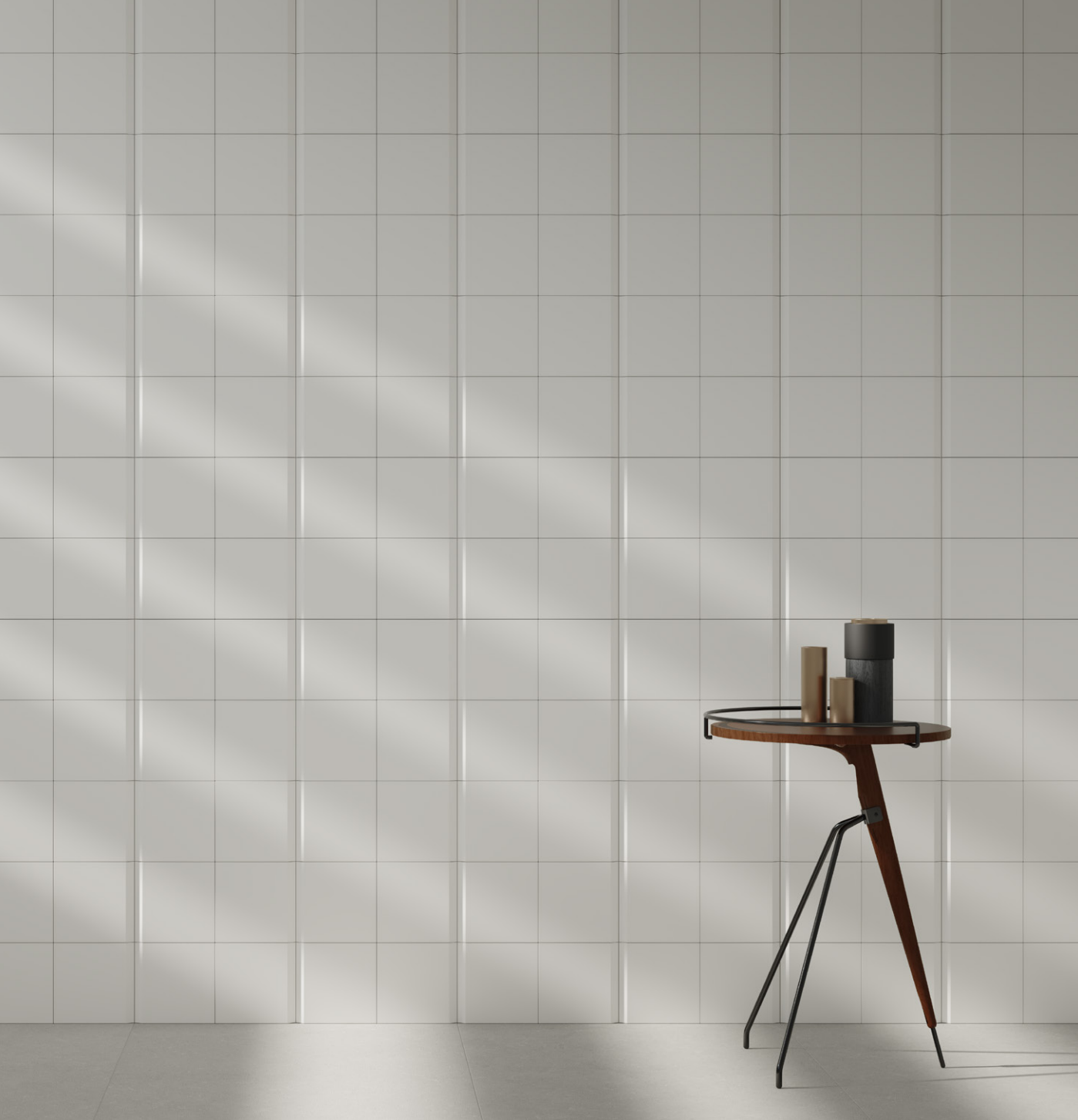
Bisel Sea Salt 15x15 (6"x6")