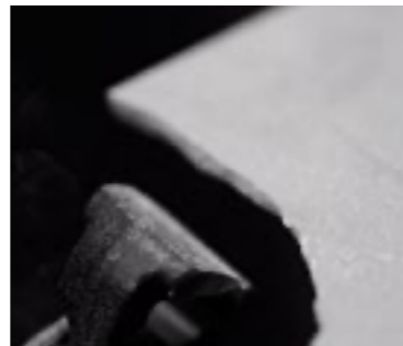
The tiles´ ductile properties make them easy to cut. Las propiedades especiales de ductile lo hacen más fácil de cortar.